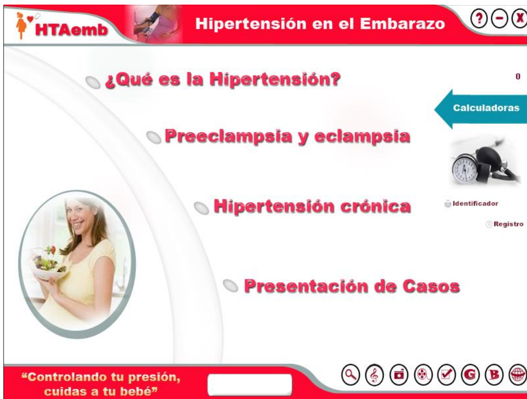
Fig. 1- Pantalla Principal.

Pantallas de identificación y registro: La multimedia contiene un registro en el que se insertan los nombre(s) y apellidos y el grupo al que se pertenece, seleccionando la opción guardar y los datos quedarán almacenados. Se puede registrar la identificación y los puntos obtenidos en los ejercicios en la base de datos de la multimedia.