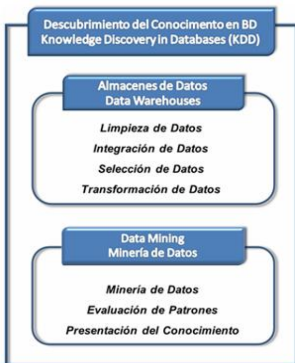
Fig. 1. Procesos que involucra el Descubrimiento de Conocimiento 5

Aunque algunos autores usan los términos Minería de Datos y KDD indistintamente, como sinónimos, existen claras diferencias entre los dos (Fig. 1). Así la mayoría de los autores coinciden en referirse al KDD como un proceso que consta de un conjunto de fases, una de las cuales es la minería de datos. 4 De acuerdo con esto, el proceso de minería de datos consiste únicamente en la aplicación de un algoritmo para extraer patrones de datos y se llamará KDD al proceso completo que incluye pre-procesamiento, minería y post-procesamiento de los datos.