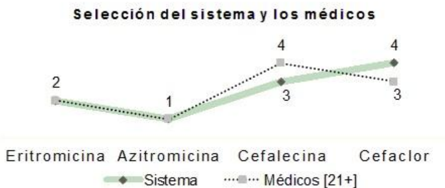
Fig. 6. Resultado de la comparación entre la selección del médico y la del sistema

Como resultado se obtuvo que en ninguna circunstancia los médicos recetan ni Ampicilina, ni Oxacillina, la selección del medicamento Amoxicilina (2.05 %), Ciprofloxacina (3.75 %), Tetraciclina (7.50 %) y Sulfaprín (11.25 %), fue de muy baja selección, además un estudio posterior del Formulario Nacional del Medicamento demostró que los mismos tienen entre sus contraindicaciones el uso en niños. Los médicos seleccionan del 1 al 4, teniendo en cuenta cuál sería el primer medicamento que ellos prescribieron y el último. Realizando una comparación entre lo que haría el médico y lo que hizo el sistema, el resultado se muestra en la siguiente figura 6.