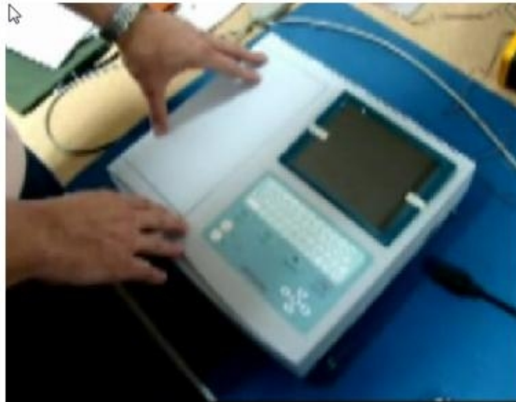
Fig. 3. Partes del CARDIOCID 200.

- Video 3: Busca familiarizar al estudiante con las características del equipo al que se le medirán los parámetros eléctricos, el especialista explica las partes del CARDIOCID 200. (Fig. 3).