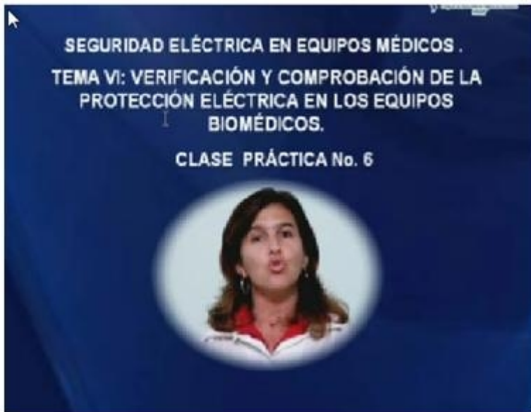
Fig. 1. Pantalla de presentación del video orientador a la clase teórico-práctica.

Por su parte, la clase teórico-práctica se estructuró en dos etapas: