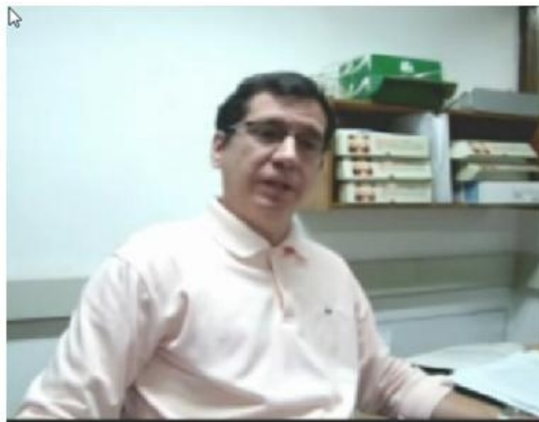
Fig. 2. Pantalla del video de presentación del ICID.

- Video 1: Su objetivo es familiarizar al estudiante con el medio donde se realizará la clase e incentivarlo al trabajo en estos centros. El especialista presenta una panorámica del ICID. (Fig. 2).