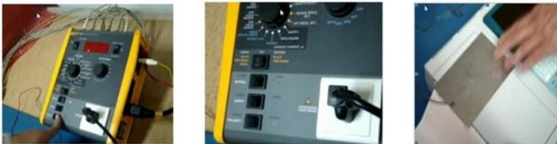
Fig. 4. Se le muestra al estudiante la medición de los diferentes parámetros eléctricos.

Los tres videos restantes tienen el objetivo de mostrar cómo se realiza la verificación y comprobación de los parámetros eléctricos para garantizar la seguridad eléctrica de los equipos biomédicos antes de ser instalados en el Sistema Nacional de Salud (Fig. 4).