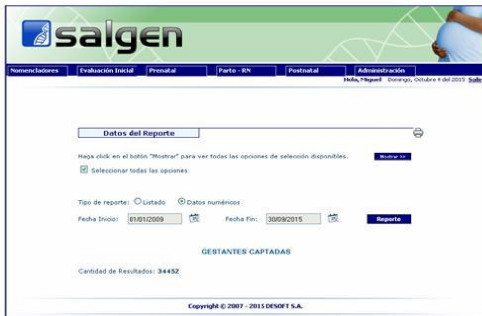
Fig. 1. Reporte de datos numéricos sobre gestantes captadas en el periodo enero 2009 a septiembre 2015

Cobertura y usuarios: A partir del 2009 se estableció el sistema como plataforma de trabajo asistencial online para la Red de Genética en la provincia. Hasta septiembre del 2015 el proyecto ha atendido 34 452 gestantes (Fig.1) y ha sido utilizado diariamente por los 23 servicios de genética comunitaria de los policlínicos a nivel de la APS y el Centro Provincial de Genética Médica que trabajan interconectados en la entrada de datos, evaluación médica y toma de decisiones. Otros usuarios acreditados con claves de entrada y categoría de invitados pueden obtener datos desde cualquier lugar con acceso a la red Infomed.