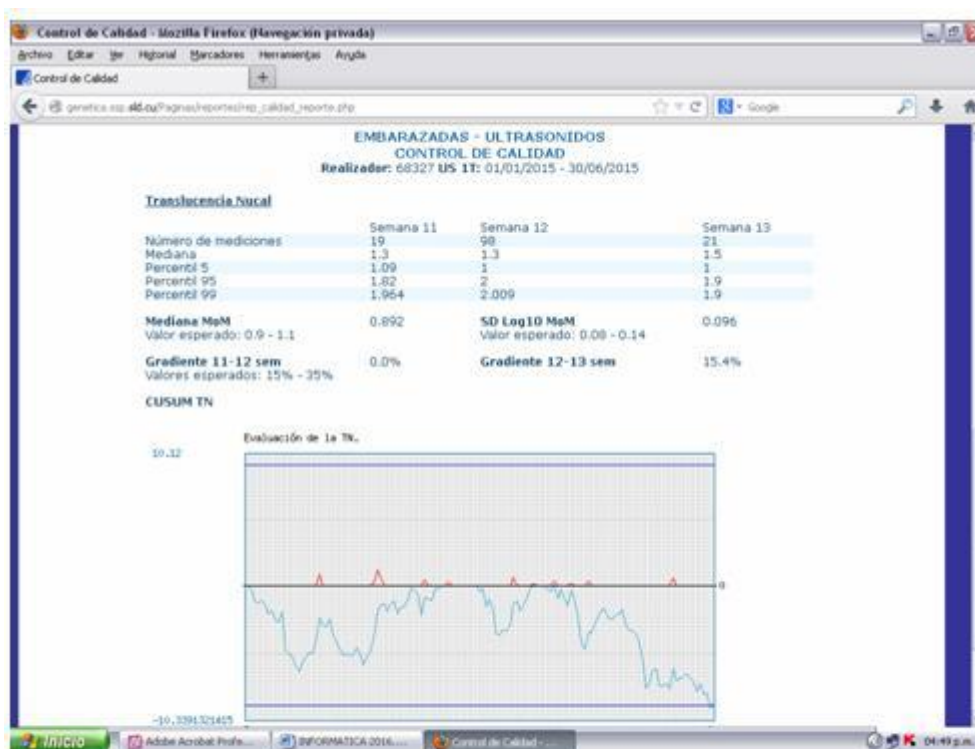
Fig. 3. Evaluación del control de calidad de la translucencia nucal en ultrasonido del primer trimestre con tendencia a la inframedición

Evaluación y autoevaluación de calidad de la ecografía prenatal: La figura 3 muestra la valoración del CUSUM en uno de los ecografistas evaluados. Este resultado y los valores de los indicadores que refiere Cuckle para el control de calidad de la TN, también accesibles en la plataforma, incrementan su utilidad al existir reportes demostrados de tendencia a la inframedición de la TN. 15-16 Los métodos cualitativos de certificaciones de calidad basados en análisis de imágenes han sido ampliamente utilizados. 17 Los ecografistas en nuestra práctica reciben una certificación inicial y recertificaciones anuales mediante actividad evaluativo presencial. Otra de las ventajas que ofrece Salgen es la de incorporar instrumentos para la evaluación cuantitativa continua de la actividad asistencial. La facilidad de acceder a los resultados de los métodos de evaluación de la calidad implementados convierte a Salgen en una herramienta para la auto evaluación continua de los ecografistas del proyecto.